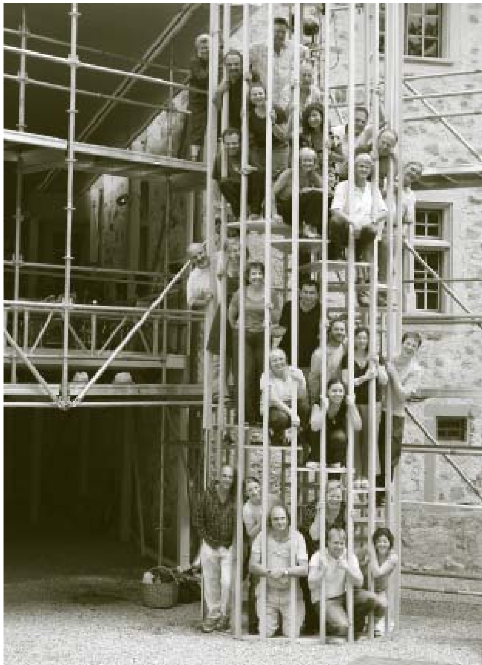
Chor Oper Schloss Hallwyl 2009