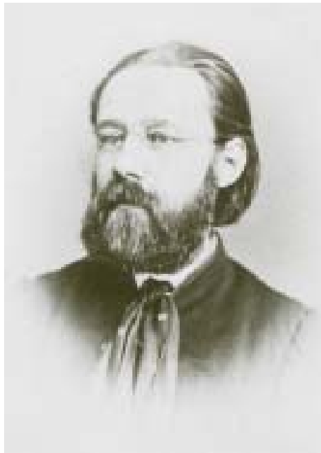
Bedřich (Friedrich) Smetana (1824 – 1884)

1871 Die verkaufte Braut in St. Petersburg aufgeführt 1872 Oper Libuše (als nationales Festspiel konzipiert) vollendet. Reise nach München zu Wagners Tristan und Isolde 1874 Oper Zwei Witwen uraufgeführt. Im Oktober völlig ertaubt. Beginn der symphonischen Dichtung Mein Vaterland 1876 Im Juni endgültige Übersiedlung nach Jabkenice zu Tochter Zofie. Oper Der Kuß uraufgeführt, Streichquartett Aus meinem Leben e-Moll vollendet 1878 Oper Das Geheimnis uraufgeführt. Symphonische Dichtung Tábor vollendet 1879 Streichquartett in e-Moll uraufgeführt. Böhmische Tänze komponiert 1881 Eröffnung des Nationaltheaters mit der Uraufführung von Libuše . Brand des Theaters. Smetana dirigiert in einem Wohltätigkeitskonzert zum letzten Mal. Zwei Witwen in Hamburg aufgeführt 1882 Festliche 100. Aufführung der Verkauften Braut . Oper Die Teufelswand uraufgeführt. Erste Gesamtaufführung der symphonischen Dichtung Mein Vaterland 1883 Wiedereröffnung des Nationaltheaters mit Libuše . Letzter Besuch in Prag 1884 Zunehmende geistige Zerrüttung während der Arbeit am Opernfragment Viola . Im April in die Landesirrenanstalt in Prag überführt. Smetana stirbt am 12. Mai. Beisetzung unter gewaltiger Beteiligung des Volkes auf dem Vyšehrad Friedhof Prag. An Smetanas Todestag beginnt alljährlich der Prager Frühling, ein internationales Kunst- und Musikfestival mit der Aufführung von Mein Vaterland .